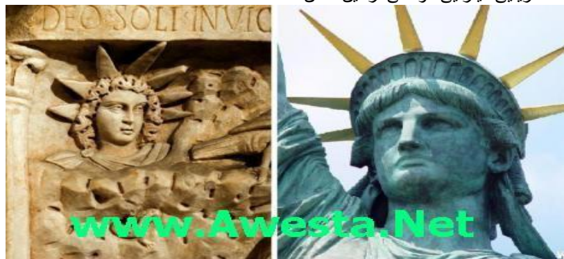
تندیس آزادی پاریس و نیویورک توسط فردریک برتولومی هنرمند فرانسوی برچهره میترا خداوند خورشید ساخته شد

مهربان یاران گرامی آیا خبر دارید که مجسمه آزادی که در پاریس و نیویورک میباشد بر چهره ی میترا و توسط یک فرانسوی میترا گرا ساخته شده است؟ اصل تصویر میترا در موزه لندن است که تاج سر مجسمه آزادی با درخشش هفت شعله بسان همان ساخته شده است و در دستی کتاب اوستا و در دست دیگر مشعل آتش زرتشت را دارد پلی که شما را به فروشگاه ایرانی اسکان میبرد در سمت راست خود پشت به برج ایفل مجسمه آزادی را دارد که تندیس نیویورک پس از آن ساخته شده است کتاب اوستا که خود کتابخانه ای بوده است با 120 جلد کتاب درباره علوم و دانشهای بسیاری که همه اینها را در دو کتاب آیین اوستا و من با خدا رقصیدم نوشته ایم و در اول سالنامه های هفت هزار ساله آریایی میترا کتاهای از این سخن آمده است