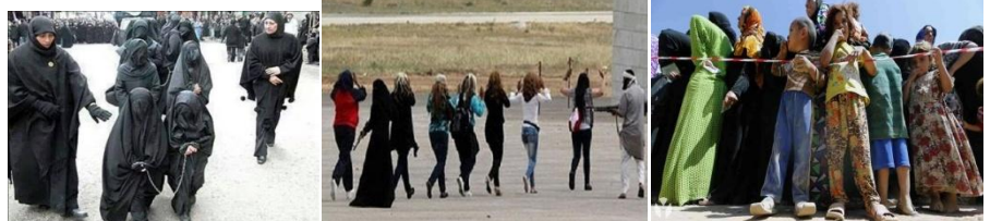
یک بار دیگر مردم دلیر و قهرمان گرد و نه کرد و ایزدیها که از ریشه ی ایزد و زرتشتی هستند در برابر ستم و جنایات جهانی تک و تنها به مصاف و جنگ تازیان رفت و هر روز حماسه نوینی آفرید

تبلیغات فرهنگی سیاسی دشمن طی 35 سال آنچنان بالا و پر خرج بوده است که مثنی مزدور معتاد و بی وطن برای چند دلار در ماه در خدمت این اهریمنان قرار گرفته و از طریق رسانه های رنگارنگ ضدیت با منافع ملی و جنگ و بغض و کینه را در میان ایرانی شعله ور نگهداشته اند و از آنسو جهان وحشی نفت و دلار هر روز با بازیهای تحریکات ثروت ملی مارا بغارت میبرد و مزدوران وطن فروش نه تنها برای آنها کف میزنند که بهترین جاسوسان و مزدوران آنها هستند از هنگام توطئه جهانی سقوط محمد رضا شاه تا به امروز به هزار و یک بهانه تبلیاردها دلار ایران را بالا کشیده و ایرانی را در جهان تروریست و خرابکار شناسانده اند و ما همه هنوز در خواب خرگوشی هستیم و ملت در داخل ایران فاکوش فرار و گریز و خروج از کشور و ایرانیان مستقر در خارج در انتظار تحقق شعارهای سی ساله ایپوزیونی که افسارش در دست خود ملاحظه و استعمار نو میباشد