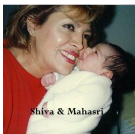
Shiva & Mahasri