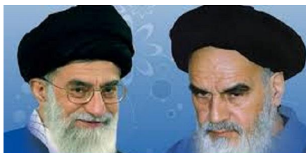
Une vidéo largement accessible montre Khomeini autorisant les services de renseignement à consommer de l'alcool, à mener des activités sexuelles et à mentir afin d'accomplir des missions d'infiltration et d'espionnage. Deux autres vidéos d'Ali Khamenei sont également disponibles, dans lesquelles il affirme avoir lui-même créé les deux factions « conservatrice » et « réformatrice », toutes deux sous son contrôle, et avoir confié cette mission à Mohammad Khatami dès son poste de ministre de la Culture